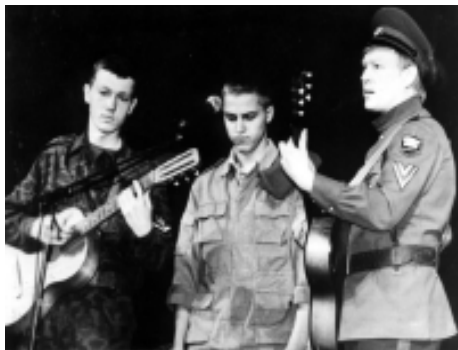
Памяти павших солдат - посвящается... («Казачья вольница», рук. В. Тоскаев)

На рассвете 1 января 1942 года части 367 с. дивизии начали наступление. Первый бой – и первый успех. Более ста квадратных километров освобождено. Прорвались далеко на юг, создавая угрозу непосредственно позициям финнов на канале и под Медвежьегорском. Казалось, ещё один напор – и победа. Но действия 367 стрелковой дивизии не были поддержаны товарищами по оружию. И финны под Медвежьегорском остановили наши части. Если первые бои были успешные,