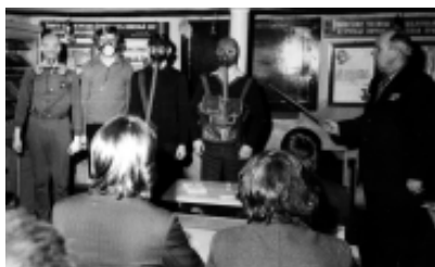
Занятия на учебном пункте города Шадринска. 1969 г.

Один из вопросов стоящих перед военным комиссариатом – это подбор и обучение преподавателей курса ОБЖ. По Приказу Министерства образования РФ и Государственного комитета РФ по делам ГО, ЧС и ликвидации последствий стихийных бедствий от 16.03.1993 г. № 66/85 “Об организации подготовки учащихся по курсу “Основы безопасности