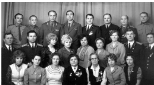
Личный состав ВК 1975 год.

В настоящее время мы трудимся так же самоотверженно не смотря на то, что произошло значительные сокращения штатов