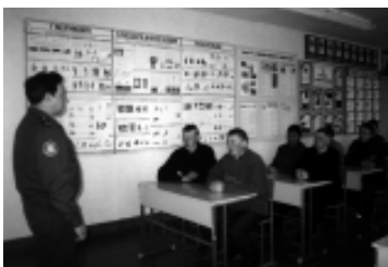
Занятия на учебном пункте Шадринского района. 2002 г.