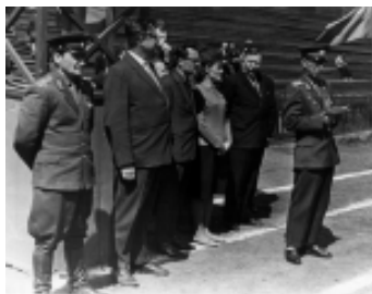
Открытие слета призывников. 1966 г.