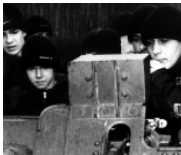
Посещение в/ч 31636 старшеклассниками г. Шадринска