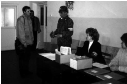
Прибытие офицеров запаса на мобилизационные сборы