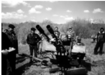
Учебные сборы граждан прибывающих в запасе на базе в/ч 31636