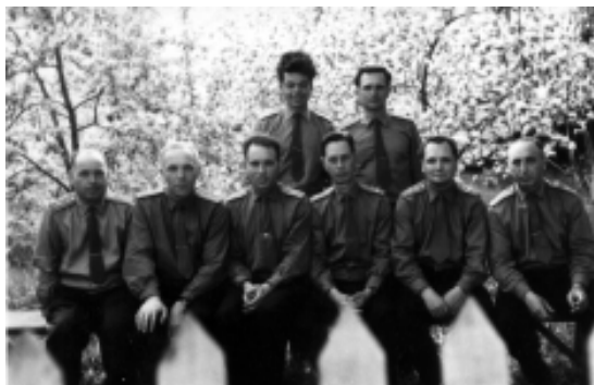
Офицеры Шадринского ОГВК 1966 г.

Ниже предлагаем Вам познакомиться с задачами и работой основных отделений объединённого военного комиссариата города Шадринска: