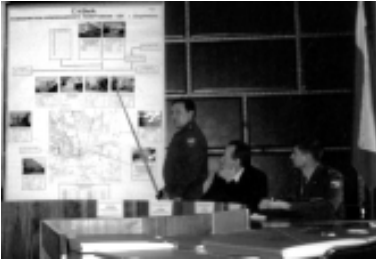
Доклад военного комиссара в администрации Шадринского района