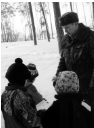
«Ставлю боевую задачу!»