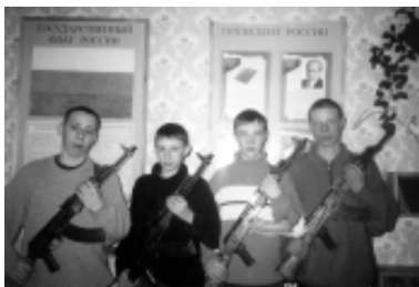
Юноши из военно-патриотического клуба "Ермак"

работа по военно-патриотическому воспитанию молодежи поднялась на более качественный уровень.