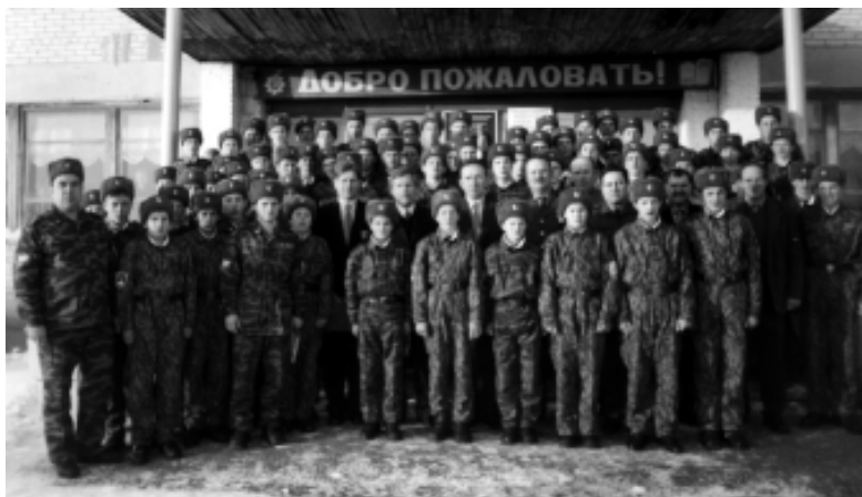
Кадетское отделение ПУ-26 (декабрь 2002 года)

Курсантам, окончившим вуз с золотой медалью и (или) с дипломом с отличием, выплачивается единовременное денежное вознаграждение. Они пользуются преимущественным правом выбора места службы в пределах установленной для вуза разрядки.