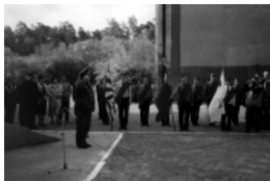
Открытие 5-дневных учебных сборов старшекласников г. Шадринска. 1999 год.

Идея Родины предполагает в человеке живое начало духовности. Духовно мёртвый человек не может быть патриотом. Патриотизм есть деятельный акт духовной свободы, духовного самоопределения. Истинный патриотизм характеризуется следованием не поверхностно – формальным признакам вроде заклинаний «Россия – великая держава», «мы – великий народ» и пр., а сущностным определением того, что любишь и того, за что любишь, т.е. любовью зрячей и действенной. Именно потому сегодня так важно любить Родину – «Счастливую великую родину, - писал Розанов, - любить, не великая вещь. Мы её должны любить именно тогда, когда она слаба, мала, унижена,