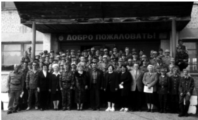
Учимся защищать Родину. (пятидневные учебные сборы старшекласников Шадринского района. 2001 г.)

в первую очередь юношей- старшекласников военному делу остался неясным. Хотя в последнее время наметились сдвиги в лучшую сторону. Совместный Приказ Министра обороны и Министра образования РФ №203 /1936 от 3.05.2001 г. «узаконил» право военного комиссариата на «оказание практической и методической помощи образовательным учреждениям в подборе преподавателей, осуществляющих подготовку по основам военной службы.» Исходя из этой ситуации, военный комиссариат должен регулярно обучать преподавателей курса ОБЖ, именно по разделу подготовки граждан к военной службе. А если учесть, что в сельской школе часто работают молодые преподаватели, которые сами не служили в армии, то сначала надо научить основам их самих и, конечно же, регулярно осуществлять контроль за качеством проведения уроков.