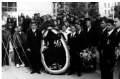
Наша боль - Чечня!

Как символ скорби и печали стал большой алый венок с единственным словом «Чечня» из черных роз, его возложили молодые парни, прошедшие бои и тяжкие испытания одной из локальных войн России”