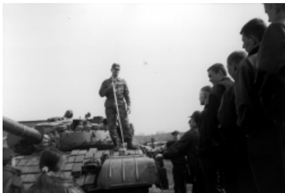
Профессиональная ориентация на будущую профессию

Кандидаты, являющиеся призерами областных и республиканских олимпиад (конкурсов) по общеобразовательным предметам, по которым проводятся вступительные экзамены в вузы, освобождаются от проверки знаний по соответствующим предметам.