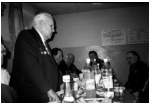
Стало доброй традицией, в канун Дня Победы ветераны Великой Отечественной, пенсионеры МО собираются в военном комиссариате, вспоминают о военных годах, о павших товарищах.

Под сенью собственного флага На стенах взятого рейхстага Мы начертали письмена: «Конец войне!», «Победа!», «Слава Тебе, Советская держава!» А рядом - наши имена. Перед грядущими веками Мы начертали их штыками, Когда окончили поход И слез не прячут ветераны, Подняв не рюмки, а стаканы, Вернувшись в сорок пятый год.