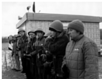
День призывника, 17.10.2002 г.