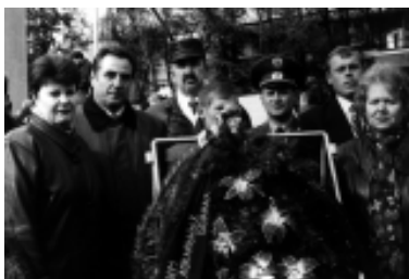
Во время возложения венка с губернатором области

С цветами и венками выстраивались у мемориала, ожидая торжественного момента его открытия, делегации из районов области. Возложение венков к обелиску возглавила делегация областной администрации во главе с губернатором Курганской Области О.А. Богомоловым.