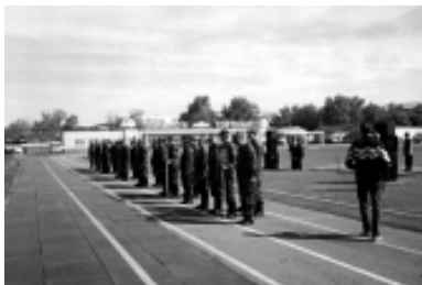
Соревнования школ РОСТО Курганской области, г. Шадринск, 2001 г.

План призывов ОВК выполняется регулярно на 100 процентов. Среди