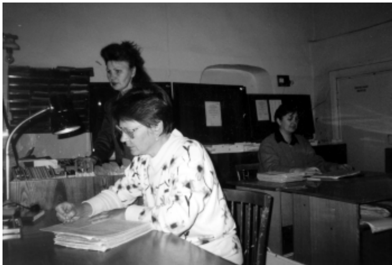
Воинский учет - это серьезно.

Внимание! Если у Вас возникли вопросы по прохождению военной