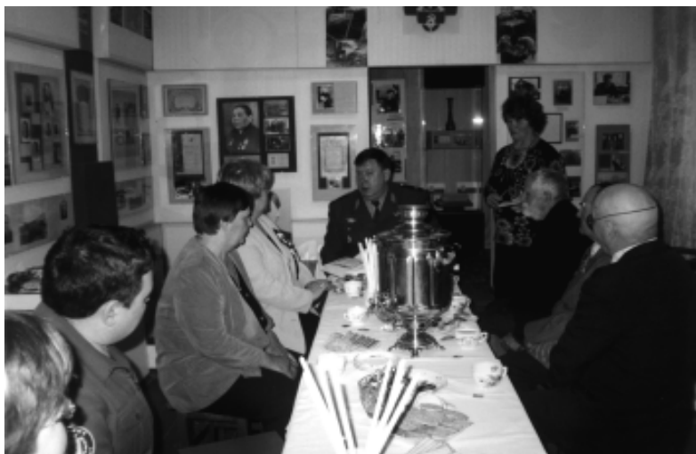
На встрече с героями, спасшими мир от фашизма, с. Красная Звезда, 2003 г.

Герой. Героизм. Что кроется за этими простыми и в то же время великими словами? Что значат они для людей? Когда я начинаю думать об этом, то передо мной из памяти встают многие десятки, а может быть и сотни образов и имен людей, реально существовавших и рожденных воображением народным. Среди них Александр Невский и Дмитрий Донской - государственные мужи и ратоборцы Руси, Микула Селянинович и Илья Муромец, Иван Сусанин и Александр Матросов, чьи яркие деяния во имя справедливости, правды, добра и Родины не сотрут ни время, ни новые великие свершения и подвиги. Героизм в человеческой личности формируется, прежде всего, знанием истории своей страны, лучших традиций народа, уверенностью в правоте дела, ради которого люди шли и идут на подвиг.