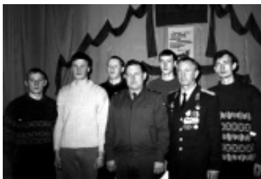
Команда автошколы РОСТО - победитель районных соревнований, с. Батурино, 22.01.2001 г.