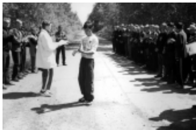
Грамоты лучшим спортсменам

Каждый молодой человек – потенциальный защитник своего Отечества. Он должен быть готов выполнить свой долг – защитить свой дом, свою семью, свою страну. Взаимодействуя с местными органами образования, военный комиссариат оказывает активную помощь общеобразовательным школам, лицеям, гимназиям, средним специальным учебным заведениям в организации и проведении подготовки юношей к военной службе, овладении ими военно-учетными специальностями и военно-прикладными видами спорта. Именно с порога военкомата начинается Российская Армия, но и здесь же ближайший тыл, где обеспечивается надежность защиты Отечества.