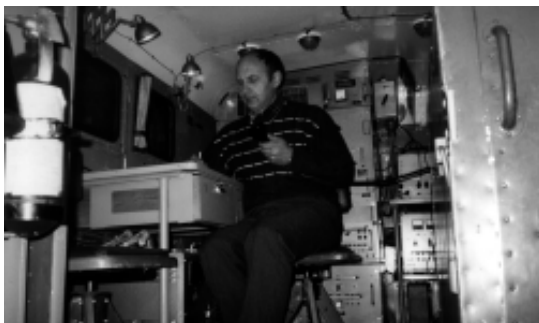
Ежемесячно проводятся радио тренировки экипажа радиостанции Р-140.