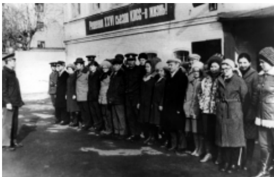
Митинг личного состава перед началом Коммунистического субботника

военного комиссариата и особенно 1-го отделения. Мобилизационные задания постоянно увеличиваются при одновременном уменьшении численности работающих."