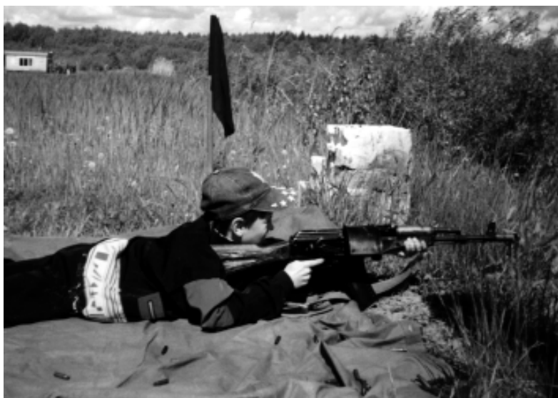
Учиться стрелять можно и в 13 лет

жизнедеятельности" в общеобразовательных учреждениях", в пункте 7 сказано, что Штабам гражданской обороны оказывать методическую и практическую помощь образовательным учреждениям в осуществлении обучения по курсу ОБЖ, а также в подготовке и переподготовке преподавателей – организаторов ОБЖ. Сделав один неправильный шаг и ликвидировав НВП (начальную военную подготовку) в школах, чиновники наделённые властью, вспомнили, что призыв в вооруженные силы никто не отменял. Не придумав ничего лучшего, они вставили подготовку граждан к военной службе во вновь созданный предмет ОБЖ отдельным разделом. Сам же механизм подбора преподавателей для обучения