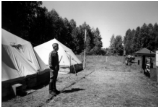
Переподготовка «запасников» по военно-учетным специальностям, июль 2002г.

службы в запасе солдатами, сержантами и прапорщиками, розыску архивных документов, учёту и бронированию, обращайтесь в кабинеты №6 и №7 (тел. 5 – 04- 03)