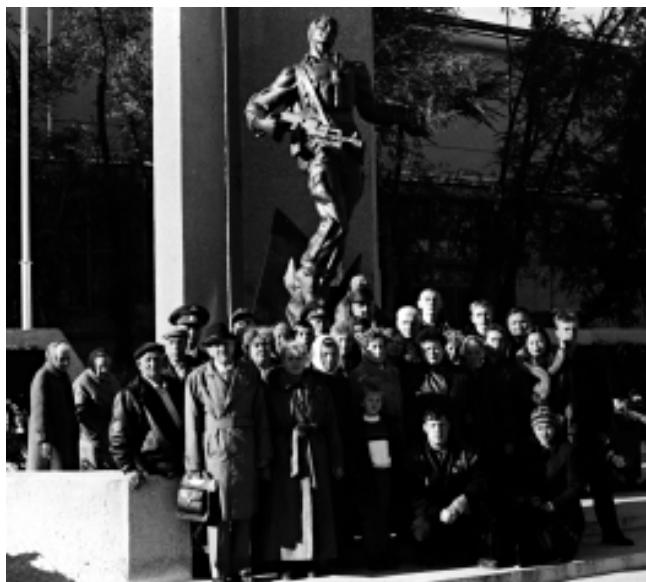
Делегация г. Шадринска и Шадринского района на открытии Мемориала войнам-зауральцам, погибшим в локальных войнах и вооруженных конфликтах.