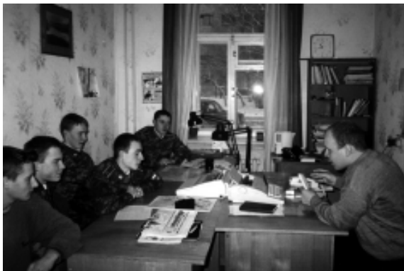
Встреча в редакции «Шадринского курьера»

Важное место в образовательном процессе занимает воспитательная работа, направленная на формирование у будущих офицеров общей культуры, высоких морально-боевых и нравственных качеств, верности воинскому долгу. Для отлично и хорошо успевающих курсантов предусмотрены льготы и поощрения, направленные на стимулирование добросовестного учебного труда.