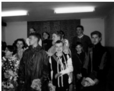
Юнармейские соревнования школьников г. Шадринска