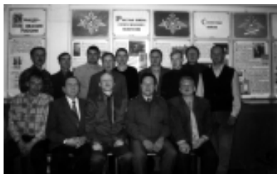
После занятий с преподавателями ОБЖ

покоряла, а безупречное знание оружия и меткая стрельба вызывали уважение подростков. Рассказы о боях заставляли ребят задуматься, что такое война.