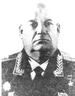
Герой Сталинграда генерал Шумилов