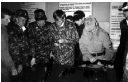
Изучаем автомат Калашникова.